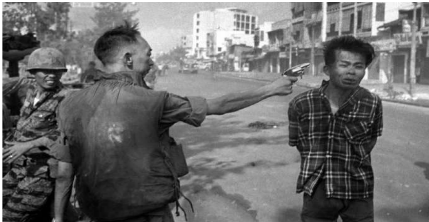
Photo d'Eddie Adams/AP, 1968 montrant le général sud-vietnamien Nguyen Ngoc Loan, chef de la police nationale, tuant d'une balle dans la tête un militant du Viêt-Cong.

Source : http://www.wbur.org/hereandnow/2017/03/31/vietnam-war-photos-associated-press